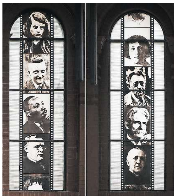
Ungewöhnliches Kirchenfenster in der Apostelkirche in Hamburg-Eimsbüttel von Bernhard Hirche.

Die erstmalige Dokumentation der Kirchenglasmalerei ist gleichzeitig eine notwendige Archivierung. Denn: „Immer mehr Kirchen werden entwidmet, umgewidmet oder abgebaut“, sagt der Autor. „Und damit verschwinden auch die Kirchenfenster.“