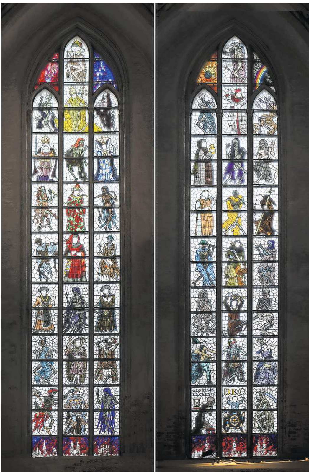
Lübecks Marienkirche: Fenster von Alfred Mahlau aus der Werkstatt Berkentien.

Historische Fenster haben es kaum in die Neuzeit geschafft. In Breitenfelde bei Mölln ist ein Fenster aus dem 13. Jahrhundert erhalten, und die Fenster des Hamburger Mariendoms aus dem 15. Jahrhundert, der 1805 abgebrochen wurde, sind dank des